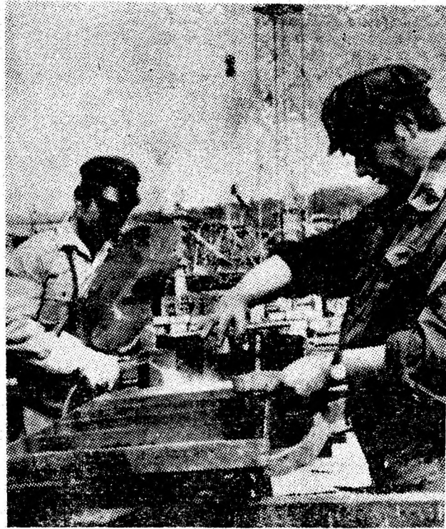
O imagine de muncă înfățișă zilnic pe șantierele viitoare preparării de la Livezeni.