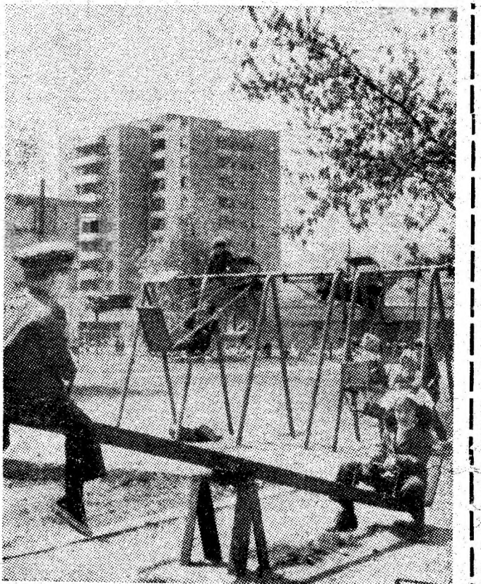
Filă de vacanță.

ția din Valea Jiului, laureată a primei ediții a Festivalului național „Cîntarea României”, are cînsa de a reprezenta județul nostru în primul spectacol televizat al „Galei antenelor”, în care își dau concursul artiștii amatori din județele Timiș, Caraș-Severin și Arad. (I.V.)