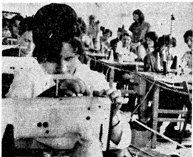
Instantaneu din secția confecției a fabricii de tricotaie care în curînd își va începe procesul de producție.