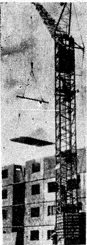
Peste tot în Valea noastră „răsar” noi blocuri de locuințe pentru oamenii muncii.

Avem deci puține grădini de vară și acele care sînt de pildă la Lupeni, reclamă destule măsuri de extindere, înzestrare și aprovizionare pentru a deveni, cum li se spune. În nici o grădină nu se întîlnește atmosfera familiară așteptată de la asemenea unități. Lipsesc grădinile de vară destinate tineretului, femeilor și copiilor, în care să se servească în exclusivitate răcoritoare și produse de cofetărie și patiserie. Prezența unor astfel de unități de alimentație publică, de profilul și finuta care să răspundă cerințelor și exigențelor consumatorilor; necesită fără îndoială din partea tuturor întreprinderilor comerciale preocupări susținute, actuale și de perspectivă.