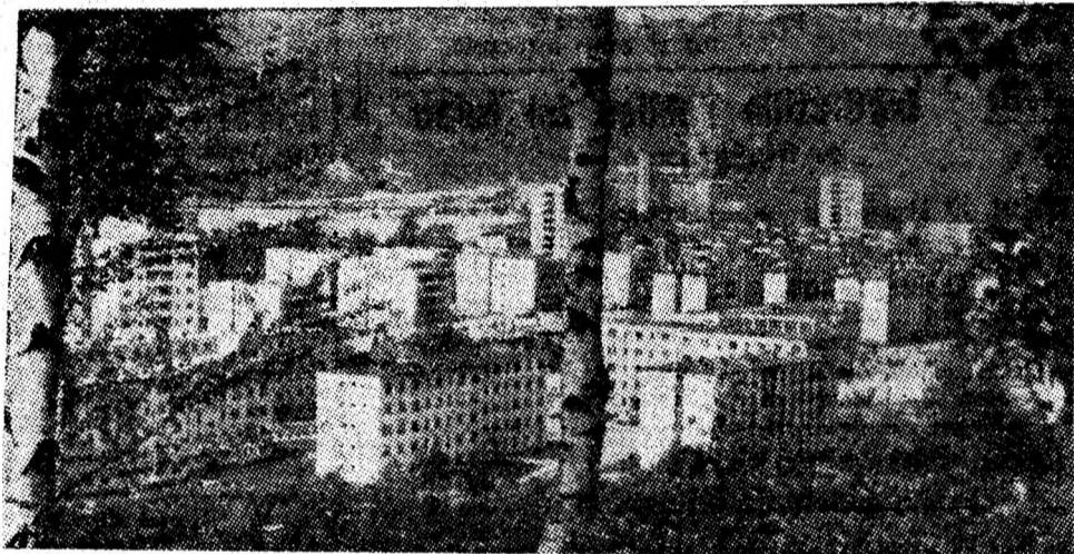
Arhitectura modernă a noului cartier Aeroport din Petroșani, cartier a cărui populație întrece pe cea a unor orașe.