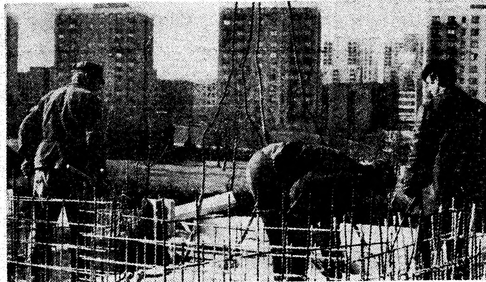
Activitate efervescentă a constructorilor din Vulcan. În aceste zile de iulie, se fixează ultimele panouri la blocul 1M din noul centru civic al orașului.

brigăzile conduse de Marin Baltac și Ioan Bud (sectorul V) cu 3 și respectiv 2,5 tone pe post, iar de la sectorul VII Ion Calotă cu 2,7 tone pe post și Constantin Popa cu peste o tonă pe post mai mult decît productivitatea planificată.