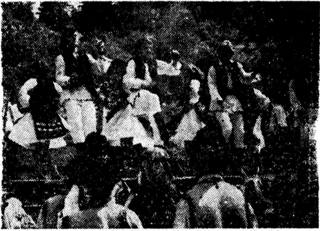
Ansamblul „Hategana” pe estrada de la Brăița — Lupeni.