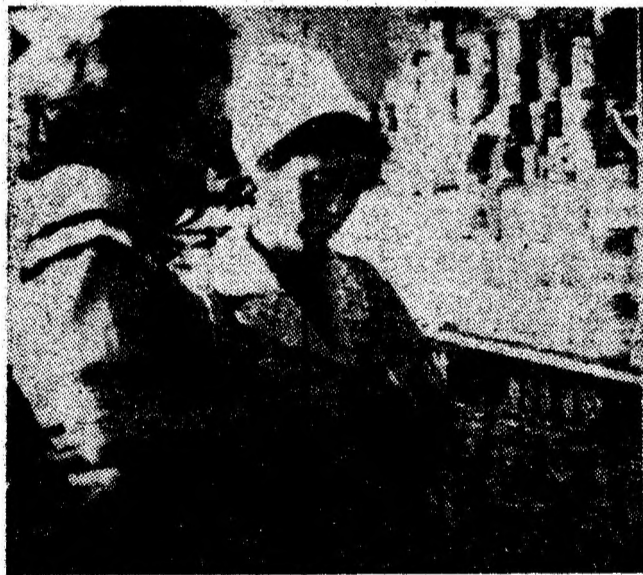
Aspect din magazinul cu autoservire nr. 58 din Vulcan, unitate în care este o bună aprovizionare, servirea la înălțimea exigențelor.

Adunările generale ale reprezentanților oamenilor muncii de la întreprindere comercială de stat mărfuri alimentare, alimentația publică și întreprindere comercială de stat mărfuri industriale din Petroșani au constituit un bun prilej de analiză a modului în care colectivele de lucrători din domeniul comerțului s-au preocupat de realizarea planului, de aprovizionarea și desfacerea mărfurilor către populație în primul semestru al acestui an. Dările de seamă ale consiliilor oamenilor muncii, dezbaterile care le-au urmat au scos în evidență, pe baza analizei principalilor indicatori economico-financiari, creșterea nivelului calitativ al aprovizionării populației. În primele șase luni ale acestui an în sectorul mărfurilor alimentare și a-