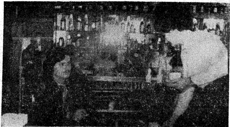
Noul cafe-bar din Vulcan la primele ore de la deschidere.