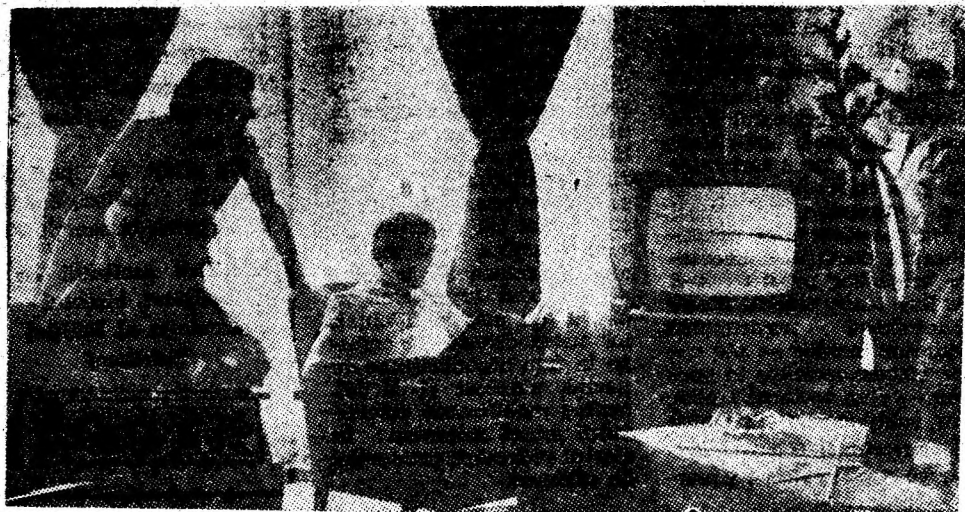
Instantaneu din holul noului hotel din Petroșani.