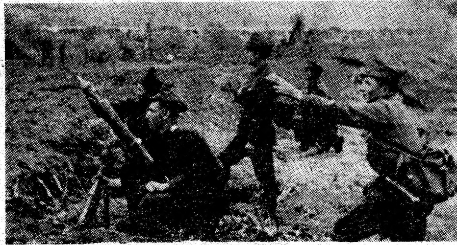
1944. Ostași români pe frontul antihitlerist.

chaiseră pe neașteptate foc. Lovit în plin, autovehiculul din fața coloanei se răsuci pe roți și încereni. Celelalte intrară unul în altul, producîndu-se busculada.