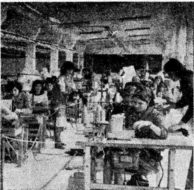
Aspect din secția confecționării a noui fabrici de tricotate din Petroșani.