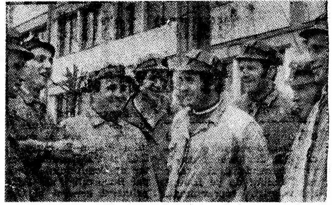
Hotărîre, voință fermă de a înfăptui politica partidului și statului nostru, de a da economiei naționale cit mai mult cărbune — aceste comandamente majore îi insuflă în această zi de marea sărbătoare pe minerii Lupeniului.

Sub semnul bogatelor împliniri socialiste, alături de întregul popor, Valea Jiului, colectivele de muncă din municipiul nostru, avînd în frunte organele și organizațiile de partid și