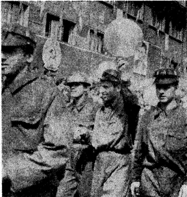
Demonstrația oamenilor muncii din Valea Jiului o deschid minierii.

Peste tribuna, peste mulțimea aflată în preajma ei răsună acordurile înălțătoare ale Imnului de Stat al Republicii Socialiste România, moment solemn