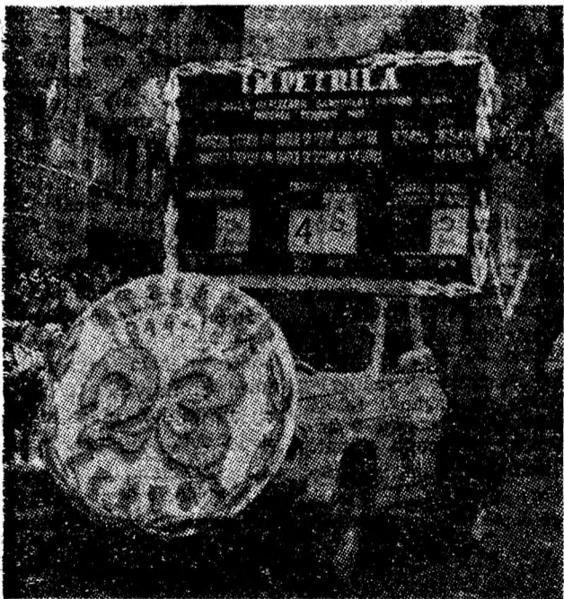
Un sugestiv car alegoric înfățișînd munca rodnică din adîncurile minei Petrila.

Puternic detașament al clasei noastre muncitoare, fii devotați ai țării, oamenii Vulcanului — români, maghiari, germani —, înfrățiți în idealuri, pășeau cu justificată mîndrie prin fața tribunei purtînd portretul conducătorului iubit al partidului și statului nostru, tovarășul Nicolae Ceaușescu, lozinci și grafice sugestive, dînd glas din mîile de piepturi voinței și holaririi de a munci fără preget pentru propășirea țării lor — România socialistă. (G. Dorin și G. Constantin)