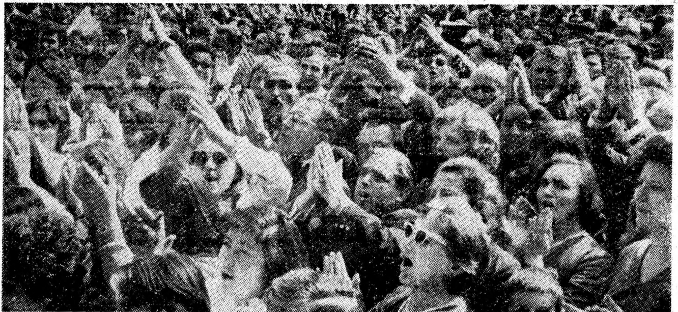
Din mii de piepturi, într-un singur glas, cei prezenți la grandioasa manifestare își exprimă dragostea fierbinte pentru partid, pentru conducătorul său, tovarășul Nicolae Ceaușescu.