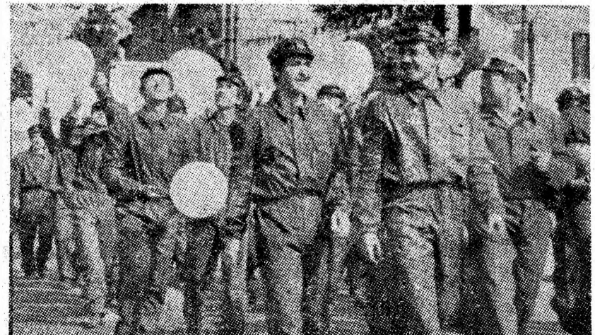
Prin fața tribunei defilează minerii din Petrila care raportează c semnate succese la producția de cărbune.

Mîndri de ținut vășir sus, exprim și atașament față de poli a partidului, te întregul n calea luminc mului, spre le civilizate minerii, pre tractorii, toți cii din oraș frunte cu con nifestat hotă strămutată d neabătut pro dului, progra român în ca priul prograr stare și feric