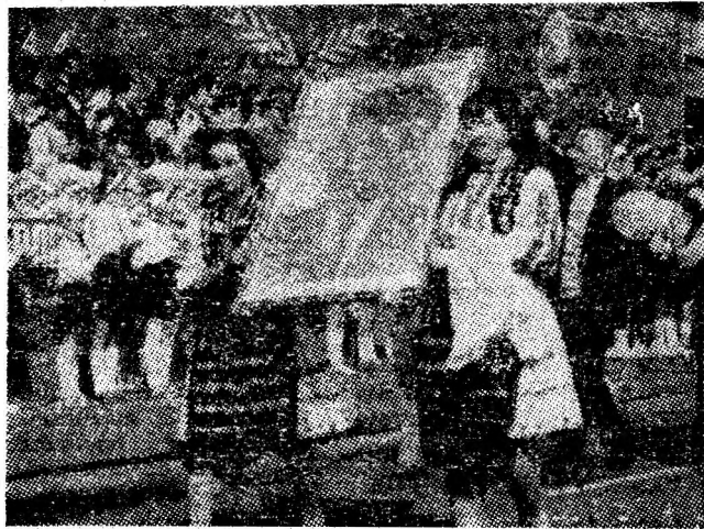
Evoluează formațiile artistice de amatori.

Impresionanta coloană a Lupeniului, formată din aproape 3000 de oameni ai muncii a adus în fața tri-bunei oficiale angajarea comunistă, muncitorească a acestui oraș de a îmbogăți tot mai mult tradițiile sale de muncă, de a ridica rez-ultările economice și so-ciale la noi cote cantitative și calitative. (I. Mustăță)