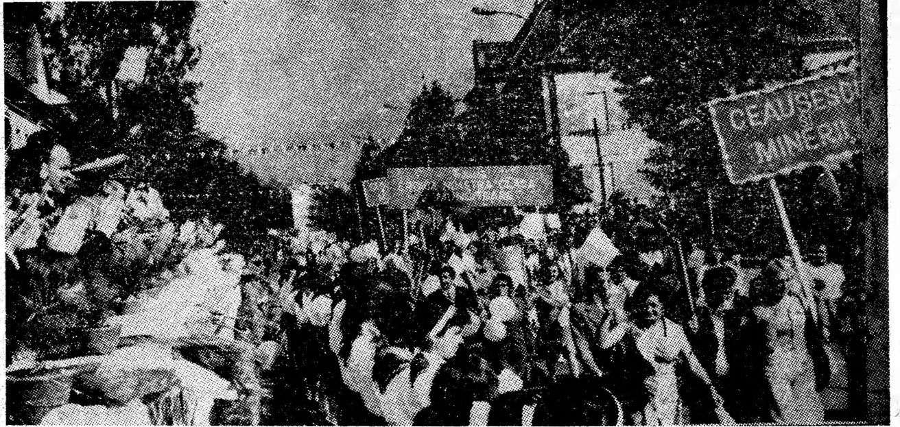
Artera principală a Petroșaniului s-a transformat într-un impresionant fluviu uman.

Demonstrează, raportând cu mândrie succesele lor pe frontul cărbunelui, harnicii mineri ai Paroșeniului.