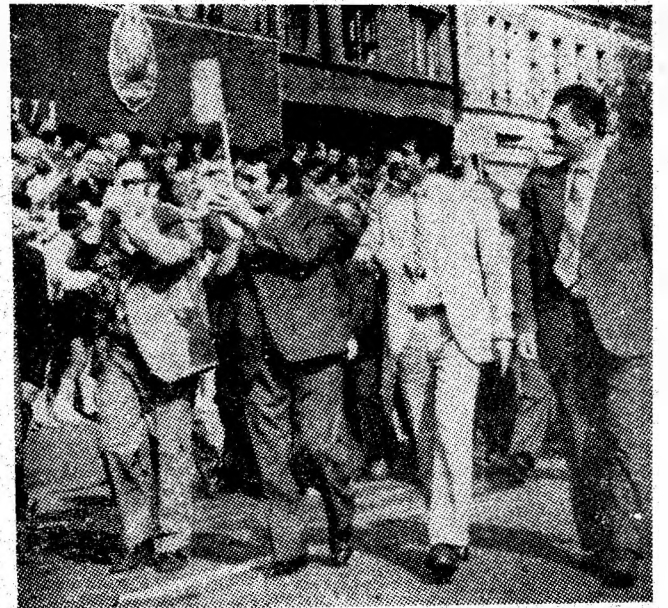
Prin fața tribunei trece cu entuziasm coloana minerilor din Uricani.