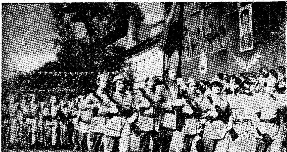
În pas cadențat trec gărzile patriotice, cei care sînt gata oricînd să apere cuceririle revoluționare ale poporului nostru.

Coloana colectivului I.F.A. „Viscoza” Lupeni a fost deschisă de un frumos car alegoric, care a simbolizat munca harnicilor filatoare.