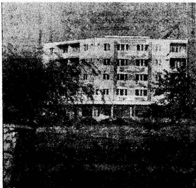
Modernul bloc de locuințe 1 M, primul din salba de blocuri ce se înalță în noul centru civic al Vulcanului.

Pe șantierul fabricii de produse electrotehnice din Petroșani — obiectiv de investiții cuprins în programul suplimentar de dezvoltare social-economică a municipiului în următorii ani — constructorii și mecanizatorii T.C. Ind. din Brașov au atins un stadiu de execuție semnificativ: terminarea platformei viitoarei fabricii. Cu un avans substanțial față de grafice, au fost asigurate primele elemente prefabricate din care se vor ridica halele industriale ale fabricii.