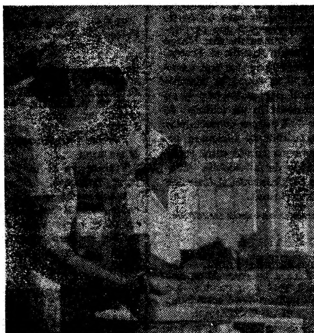
Iscușința la ea acasă. Instantaneu din laboratorul de preparate reci din Petroșani.