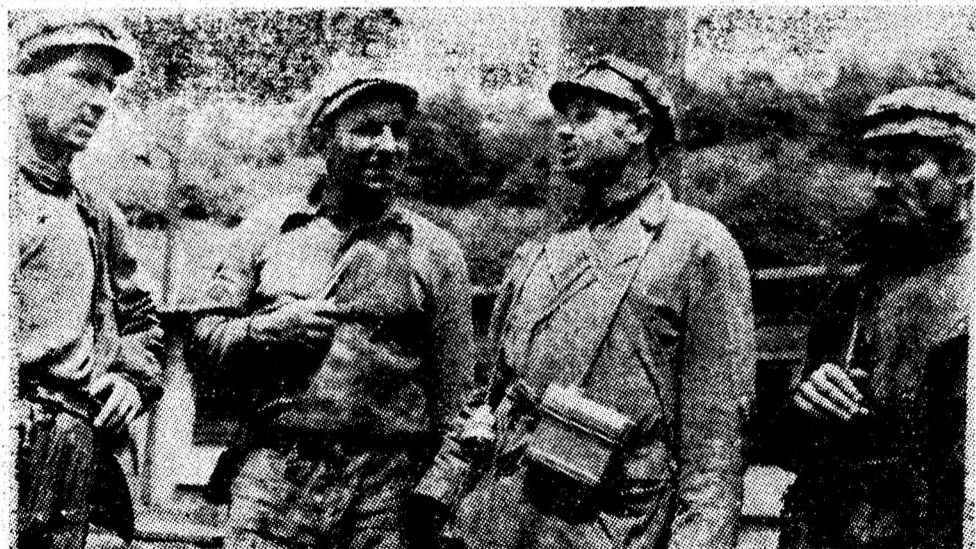
Brigada lui Ilie Chiron de la sectorul VIII investiții al minei vulcan a realizat pe acest an o depășire de 660 mc.