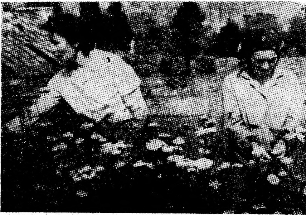
Sera aparținând E.G.C. Petroșani. Aici mîinile vrednice ale femeilor cultivă cu dragoste profesională flori, multe flori, pentru frumusețea orașelor noastre și bucuria oamenilor.