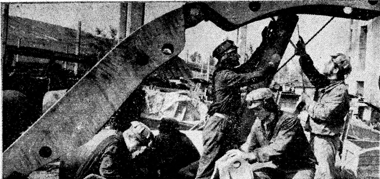
Echipe „service” de la mina Lonea în acțiune.