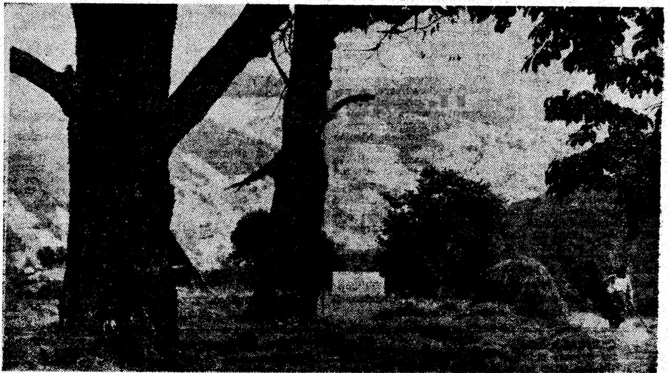
Toamna pe deal.