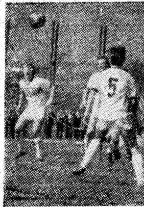
Fază din meciul de fotbal Minerul Vulcan — C.F.R. Craiova.

Duminică s-a desfășurat și prima etapă a campionatului municipal de fotbal, competiție la care participă doar șapte echipe. În cele trei partide, echipele gazde au învins la scoruri care ne scutesc de comentarii. Iată rezultatele: Energia Paroșeni — Sănătatea Vulcan 5—1; Preparatorul Lupeni — Fabrica de oxigen Livezeni 4—0 și I. G. C. L. Petrila — Preparatorul Coroești 3—0. Minerul Bărbăteni nu a jucat.