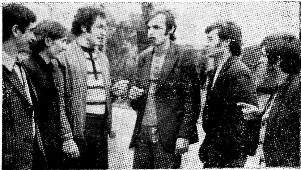
La ieșirea din șut, tinerii electrolăcătuși discută despre felul în care și-au făcut datoria la locul de muncă.

— Ați dat deja în această lună peste plan mai mult de 500 tone. — „Secretul” nu este altceva decât munca noastră, pe care, cu cât o organizăm mai bine, cu atât ne aduce satis-