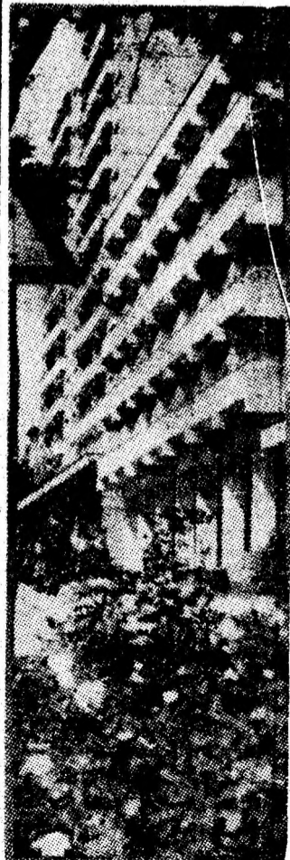
Urbanism modern caracteristic Văii noastre.