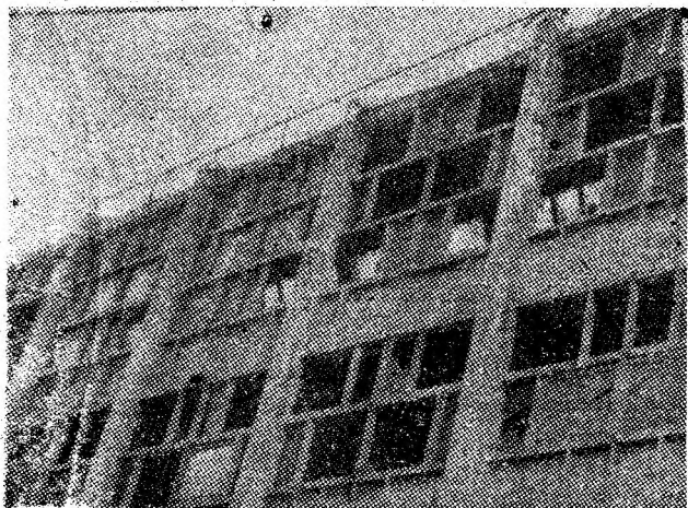
Careu de rebus? Nicidecum! Așa arată acoperișul centralei termice de lângă blocul 200 Lupeni.