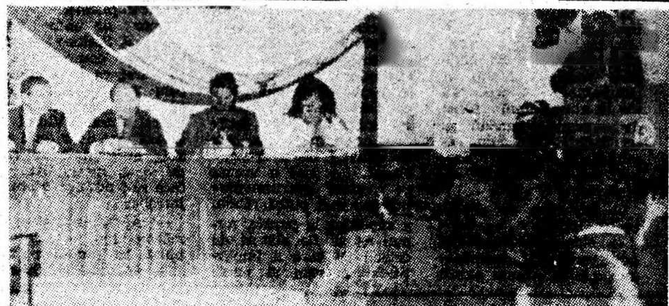
Aspect din timpul simpozionului.