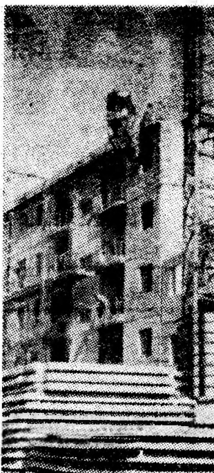
Pe șantierul din Petroșani se lucrează intens, zilnic se construiesc noi apartamente.