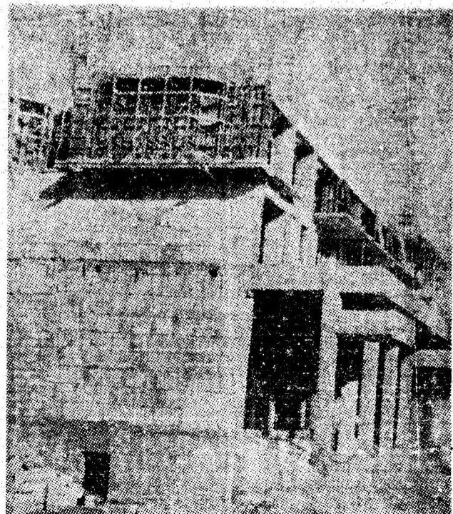
Blocul 3B1 ce se construiește în cvartalul noului centru civic al orașului Vulcan, bloc care va avea 8 etaje și spații comerciale la parter.