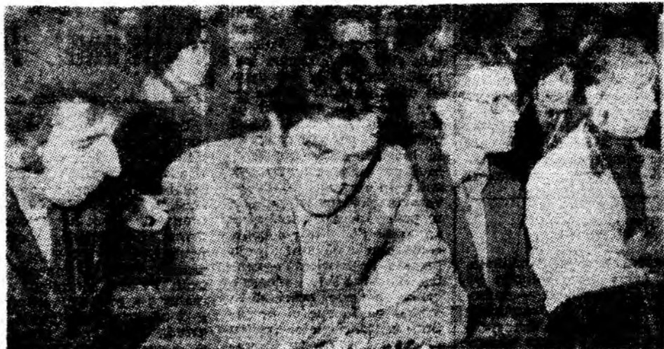
Aspect din timpul simpozionului.