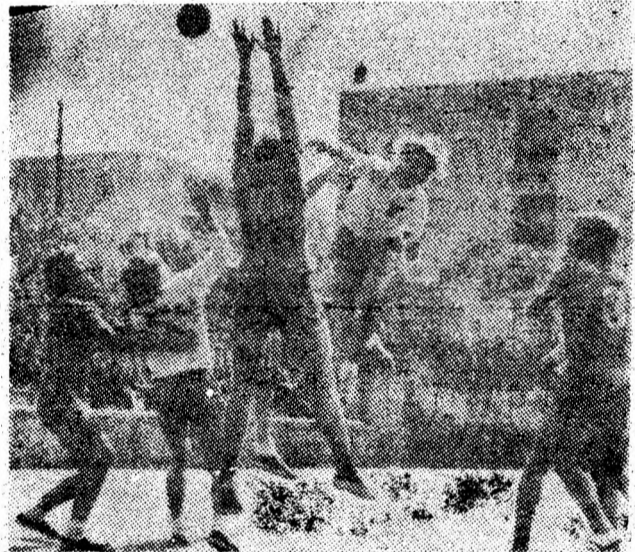
Fază spectaculoasă oferită de handbaliștii de la Utilajul-Știința din Petroșani la unul din meciurile susținute acasă.

P.S. La închiderea ediției am aflat, cu totul întîmplător, că juniorii au fost transportați și... așteptați timp de 100 de minute de numai patru taximetriști. Nu e faptul că în timp ce ar fi fost foarte necesare în municipiul nostru, tovarășii de la E.T.P., au acceptat atît de ușor dirijarea lor pe un traseu „inedit”.