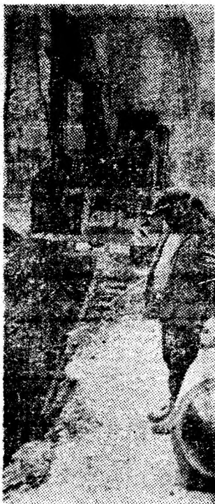
Se lucrează intens la noul sistem de canalizare a orașului Vulcan, care va capta în primul rînd apele reziduale din zona noului centru civic al orașului.

În acești 34 de ani patria noastră și-a schimbat radical înfățișarea, operă la care și-a adus contribuția în mod constant și armata noastră. Conștiința de mare responsabilitate ce le revine, însușiți de aprecierile și orientările comandantului suprem, tovarășul Nicolae Ceaușescu, militarii sînt antrenați într-o susținută muncă pentru asigurarea unei calități superioare în întreaga pregătire. Participînd activ la viața economică și social-politică, într-o continuă legătură cu poporul, armata se afirmă ca o înaltă școală de educație politică și patriotică a tinerei generații care, muncind, desăvîșindu-și pregătirea sub conducerea organizațiilor de partid, veghează asupra cuceririlor revoluționare ale României socialiste. La a 31-a aniversare, în apropierea sărbătoririi a 60 de ani de la formarea statului național unitar român, perfect organizată, temeinic pregătită, armata patriei noastre este devotată poporului, partidului, gata în orice moment să-și îndeplinească misiunea sacră de a apăra independența, suveranitatea și integritatea patriei noastre.