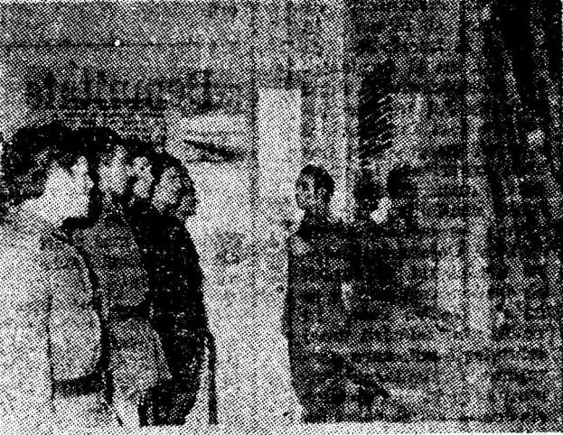
La Muzeul unității, evocînd file din cronica tradițiilor de luptă.