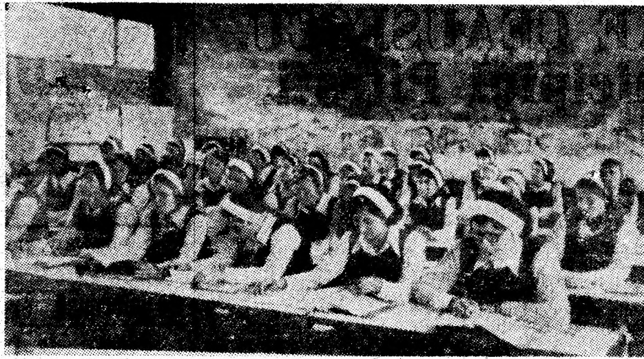
Oră de curs în modernul laborator de biologie al Liceului industrial Vulcan.