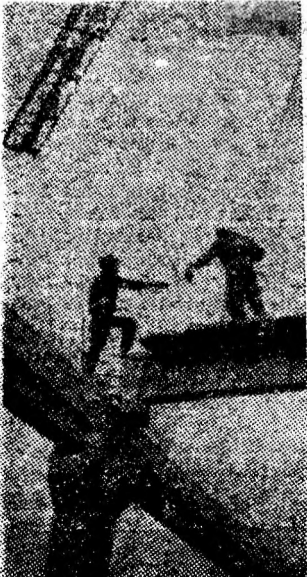
Se asamblează elementele structurii de rezistență ale noii fabrici de mobilă din Petrita.

nărul inginer Deac. Mi-a interzis documentarea, nu atît din modestie, ci pentru a trăi o adevărată bucurie. Adică, să scriu