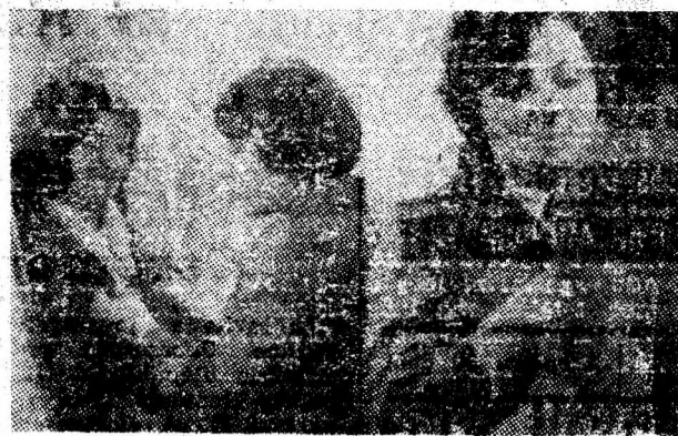
La magazinul nr. 11 Confecții din Petroșani se găsesc articole de sezon după ultima linie a modei.

„STEAGUL ROȘU“ A CRITICAT, ORGANELE VIZA TE