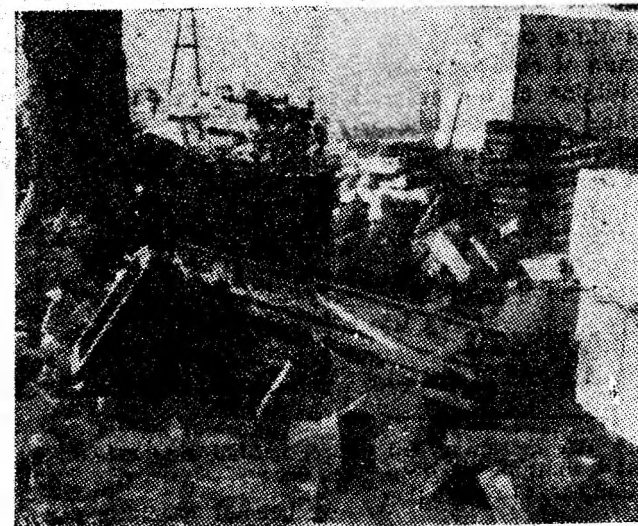
Grinzi, elemente de susținere, plăci B.C.A. „se oglindesc” în ana unei bălți de lângă blocul 3 B1.

treia a blocului K4. Și aceasta a înghețat, ca de fapt și cel din bena așezată pe platformă: