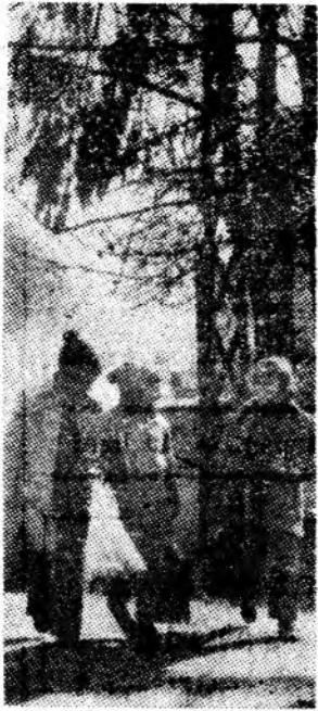
De la școală spre casă.