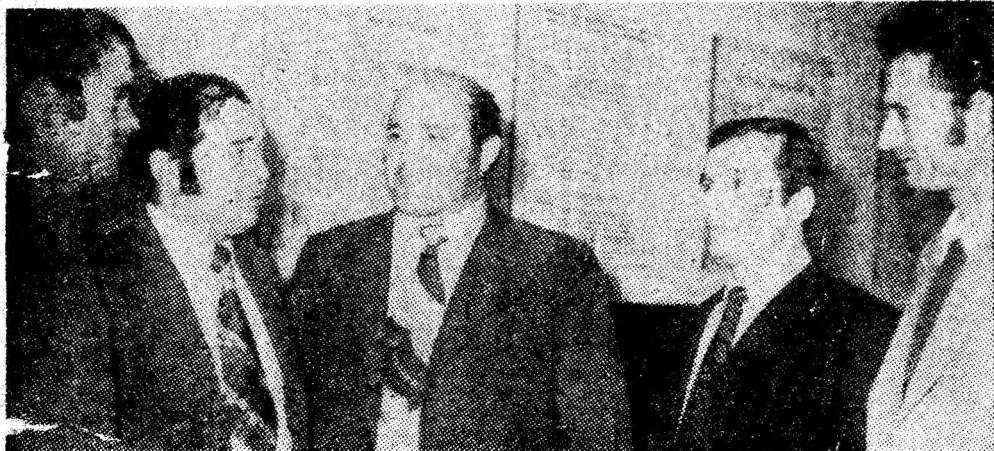
Schimb de păreri între brigadierii participanți la simpozion.