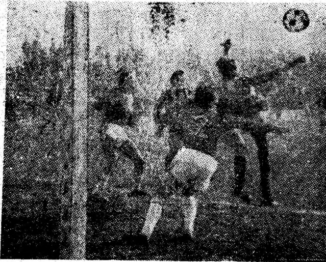
De fiecare dată atacurile Minerului Vulcan au fost respinse.