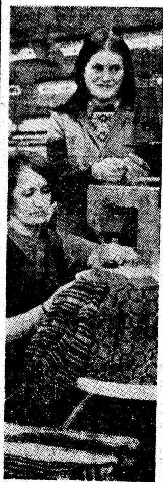
Indeminare și iscusință, prezențe de fiecare zi în activitatea secției confecții a Fabricii de tricotaie din Petroșani.

Fără îndoială că, așa cum ne relatea inginerul Ioan Pătruș, șeful compartimentului tehnic al minei, la I.M. Vulcan există încă mari resurse de reducere a consumurilor de lemn a căror valorificare ar trebui să înceapă cu mai buna sortare și dimensionare a lemnului în depozit și îmbunătățirea deservirii locurilor de muncă. Pentru anul 1979, cînd consumul de lemn urmează să fie redus pe mină cu 1,7 mc/1000 tone față de 1978, se va introduce susținerea metalică în stratul 7 și extinderea tehnologiilor care utilizează susținerea hidraulică și „tavanul de rezistență” în stratul 3. Se cere cu atît mai mult ca la toate nivelurile să se manifeste o mai mare grijă față de buna gospodărire a lemnului, a tuturor materialelor, de care depinde în mare măsură realizarea producției nete, beneficiul colectivului.