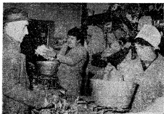
Instantaneu din unitatea C.L.F. nr. 23 din Uricani.