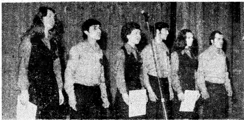
Una din brigăzile artistice care s-a afirmat printr-o bună interpretare a textului, răsplătită cu aplauze: brigada cooperativei „Unirea” din Petroșani.

Astăzi, în jurul orei 11.30, posturile de radio și televiziune vor transmite direct ceremonia sosirii președintelui Consiliului Militar Administrativ Provizoriu și al Consiliului de Miniștri ale Etiopiei Socialiste locotenent-colonel Mengistu Haile Mariam, care, la invitația tovarășului Nicolae Ceaușescu, președintele Republicii Socialiste România, va efectua o vizită oficială în țara noastră.