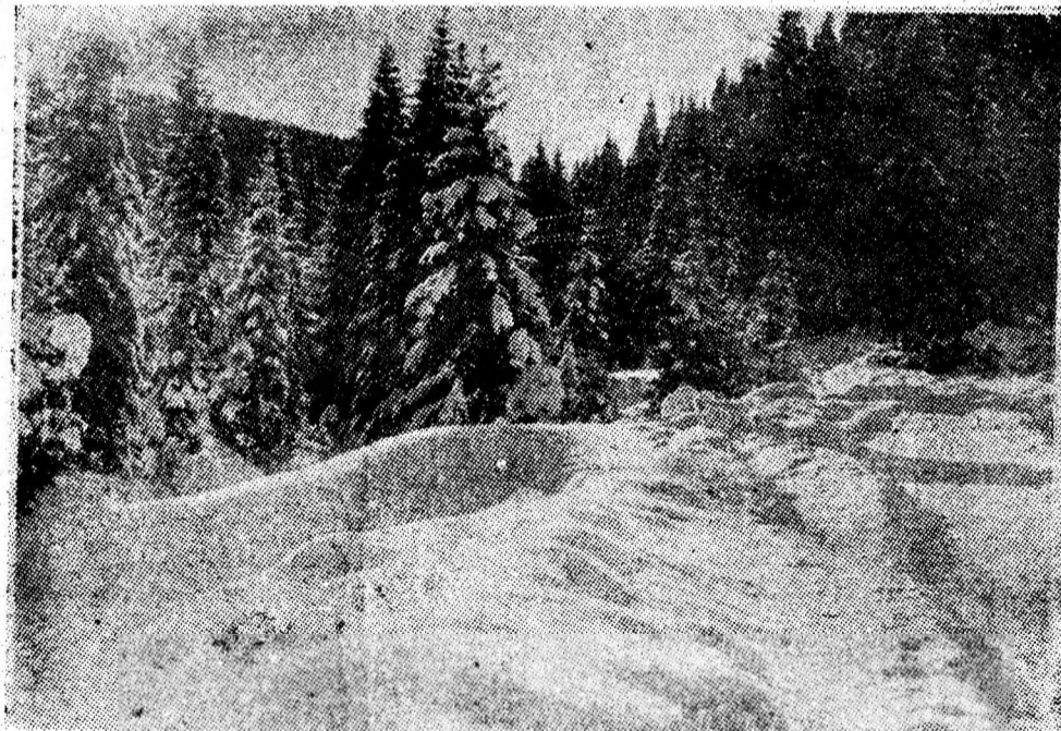
Cărările iernii duc spre incintare.