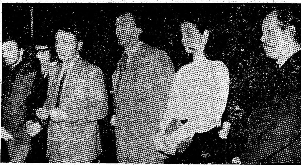
La recenta premieră de gală a filmului „Ecaterina Teodoroiu“ publicul petroșănean a avut prilejul să se întâlnească cu cîțiva dintre realizatorii și interpreții filmului.