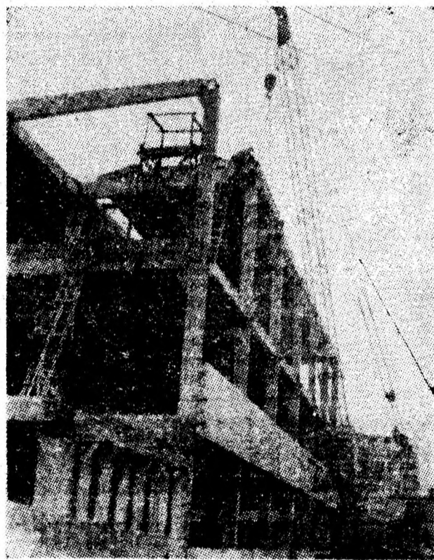
Fabrica de confecții din Vulcan se conturează tot mai pregnant în peisajul orașului.

vină mașinile să ridice gunoierii. Și cînd te gîndești că de cînd cu iarna cantitatea de cenușă este mult mai mare. Tînînd seama de importanța economisirii energiei și, bineînțeles, și a carburanților, locuitorii orașului înțeleg necesitatea reducerii curselor chiar la transportarea gunoierii menajere. Propun însă întocmirea unui grafic care să prevadă ca o dată în săptămînă mașinile salubrității să ridice reziduurile menajere de pe toate străzile. Să se facă deci un grafic pe zile și străzi, dar care să se respecte cu rigurozitate. (C.D.)