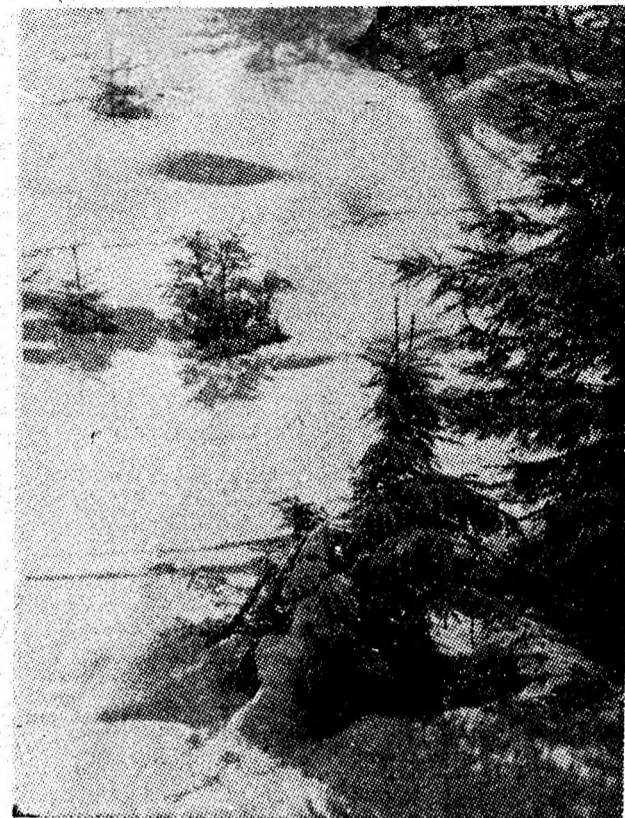
Pastel de iarnă sau invitație la drumeție pentru petrecerea sfîrșitului de săptămîină în decorul mirific și deconectant al muntelui.