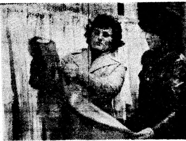
Un magazin bine aranjat și aprovizionat: nr. 10 „Tricotaje” din Petroșani.

Perioada vacanței de iarnă cuprinde totodată serbările „Pomului de iarnă” și alte activități organizate de școli, al căror grad de interes, deci și de participare, va fi proporțional cu preocupările de cunoaștere a copiilor și cu diversitatea acțiunilor adecvate vârstei și posibilităților lor de receptare. În esență, programul pentru vacanța de iarnă cuprinde diverse acțiuni destinate unui scop unic: educația elevilor prin intermediul unor activități menite să-i stimuleze spre petrecerea plăcută, odihnitoare și profitabilă fizic și intelectual a acestor zile de iarnă.