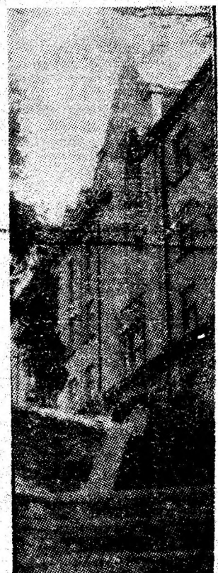
Spre Institutul de mine