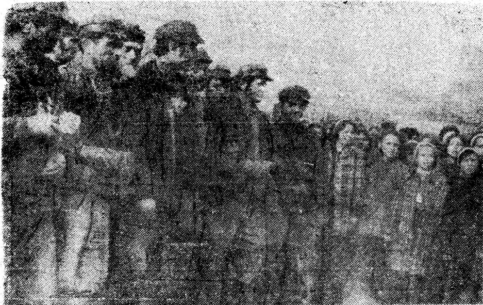
Sărbătorii de ier; ai mine; Dilja: minerii sectorului III.