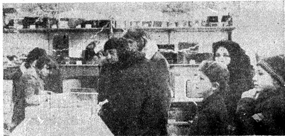
Bine aprovizionat, magazinul „Electrotehnice” din cartierul Bucura Urșani, se bucură de o mare afliuență de cumpărători.