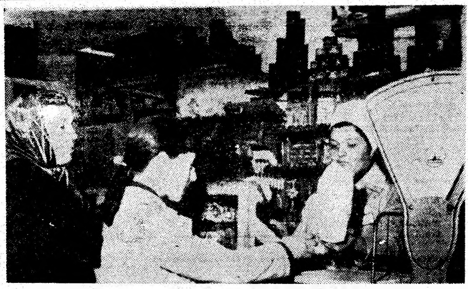
Aprovizionarea corespunzătoare și servirea civilizată a cumpărătorilor este o caracteristică generală a activității unităților comerciale din municipiul nostru.