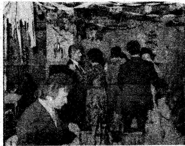
Instantaneu de la Revelionul cadrelor didactice de la Grupul școlar minier Petroșani.