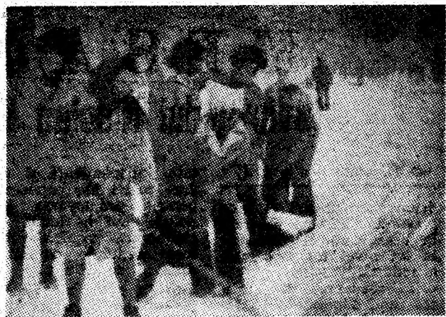
Lucrătoarele unității comerciale nr. 8 din Petroșani au trecut dis de dimineață, în ziua de 2 ianuarie, la deszăpezirea trotuarului din fața magazinului.