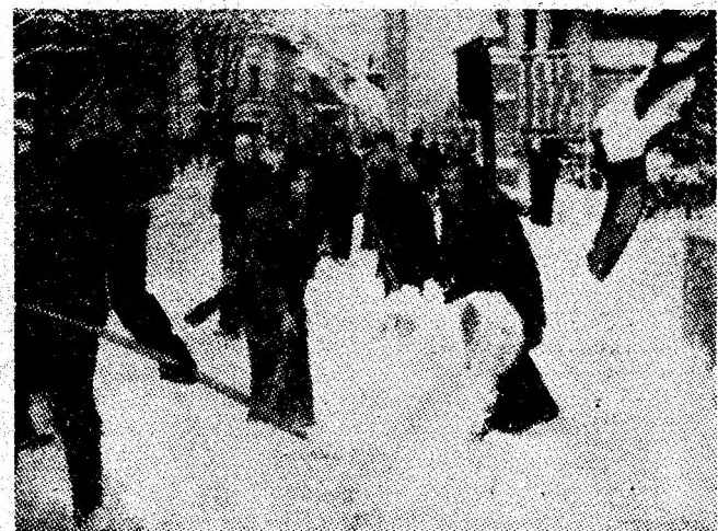
Ieri dimineață pe artera principală din Petroșani.

BIROUL DE CIRCULAȚIE AL MUNICIPIULUI PETROȘANI