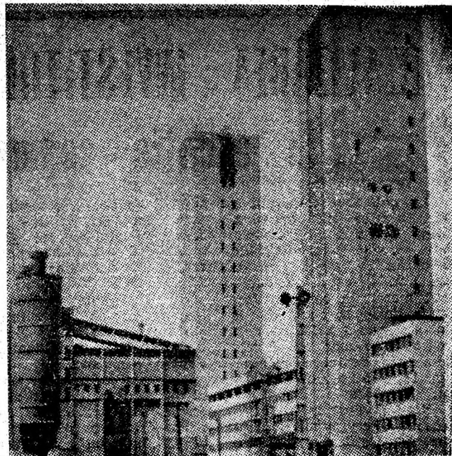
Edificii miniere în lunca Jiului din Livezeni.

1979 — anul hotărîtor al înlăptuirii obiectivelor cincinalului