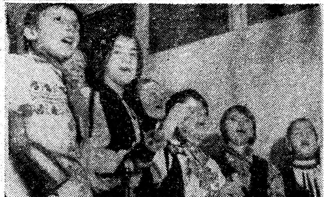
Cele mai frumoase momente ale vacanței: umblind cu Plugșorul de Anul Nou și urînd celor mari și mici tradiționalul „La mulți ani!”.

După cum lesne se poate vedea, zăpada abundentă căzută în ultimele zile a creat brusc o serie de probleme atât conducătorilor auto cât și pietonilor. Cu toată intervenția utilajelor de dezapezire, pe carosabil s-a format un strat de zăpadă tasată care, datorită înghețului, a devenit deosebit de periculoasă favorizînd derapajul. Este adevărat, a fost împrăștiat material antiderapant, dar cu toate acestea ținem să sugerăm conducătorilor auto câteva sfaturi privind conducerea pe drumurile municipiului. Dintre acestea, primul se referă la echiparea mașinilor cu pneuri în bună stare care să mărească aderența. Evitați, deci, pornirea la drum cu pneuri uzate. Verificați la ieșirea din garaj sistemul de direcție pentru ca acesta să fie în perfectă stare tehnică știut fiind faptul că orice defecțiune se poate solda cu un derapaj care, în condiții de drum alunecos, devine deosebit de periculos pentru participanții la traficul rutier.