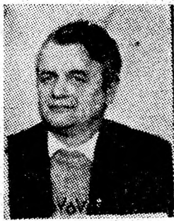
țătură și comportare exemplară.

șurii și comportare exemplară. Comunistul, sudorul și tatăl are deci multe satisfacții. Sint satisfacții firești ce îi aduce munca responsabilă în patria noastră socialistă.