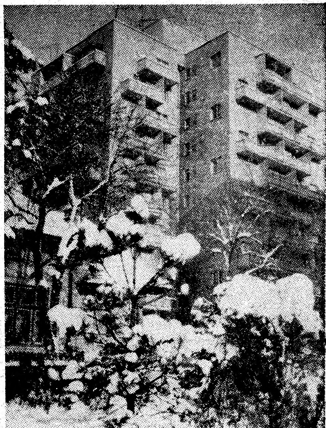
Iarnă în Petrosani.