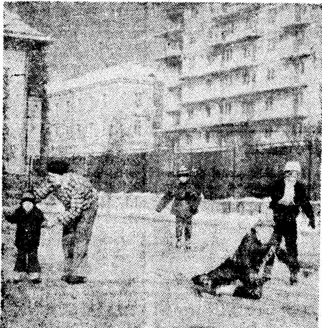
Primi pași și primele... căzături pe patinoarul din Petroșani.

Începând cu a doua zi a anului 1979 iarna s-a instalat și în Valea Jiului, cu zăpadă abundentă și geruri tocmai bune pentru practicarea schiului și patinajului. Dacă schiorii au pirtii naturale unde pot să practice sportul preferat, în schimb pentru patinaj și hochei pe gheață e necesară inițiativă și muncă pentru amenajarea unor patinoare naturale. Pentru a vedea ce s-a făcut în domeniul patinoarelor, ne-am deplasat în câteva localități din Valea Jiului.