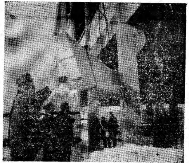
Constructorii din echipa condusă de Mihai Cojocaru montează prefabricatele la fațada halei principale a noii fabrici de mobilă din Petrița.