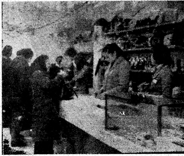
Oferind cumpărătorilor o variată gamă de produse, magazinul „Electrotehnice” din Uricani se bucură de aprecierile unanime ale populației.