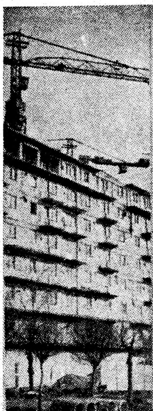
Noi blocuri de locuințe pentru oamenii muncii. În foto: blocul 69 din centrul Petroșaniului.

După cum se știe, programul băii orașului Petroșani este joi, vineri și sîmbătă, între orele 15-21. Deci trei zile pe săptămîină. Între un program și altul de funcționare a băii sînt alte trei zile lucrătoare, timp suficient pentru a se face remediările necesare. O doresc toți acei care se îndreaptă spre acest lăcaș de igienă și se întrebă cu îngrijorare: oare cînd vom face o baie ca lumea la baia orașului? D. CRIȘAN