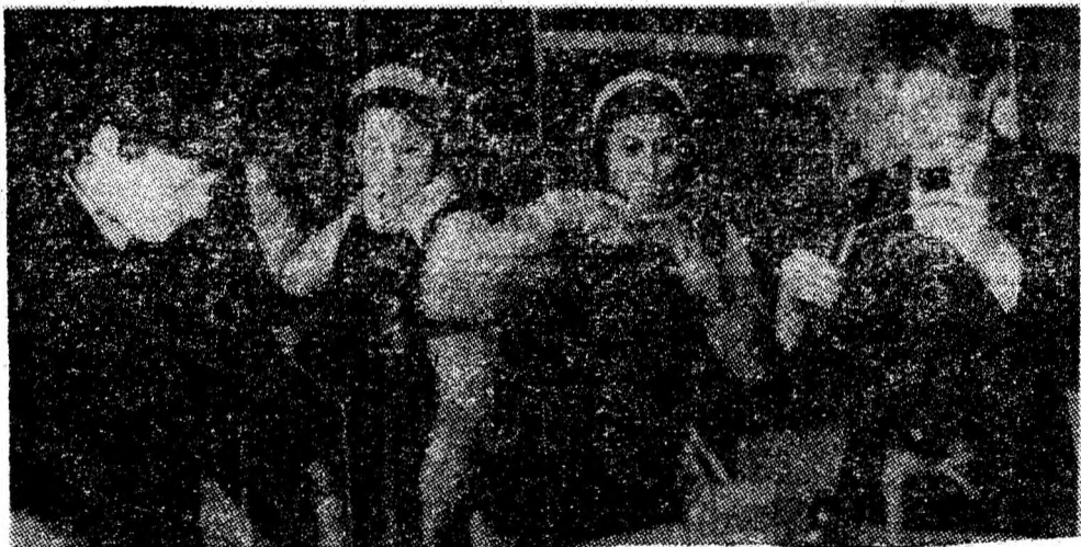
Oră de chimie în laboratorul Liceului industrial din Petroșani.

resc cu condiția să fie absolvenți de liceu. În aceeași zi, oră și loc, sînt invitați să fie prezenți, pentru împropătarea cunoștințelor și ghizii cu stagiu în activitate. (C.D.)