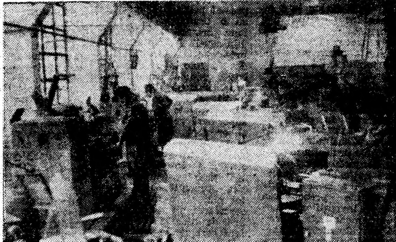
Atelierul de producție de la Institutul de mine.