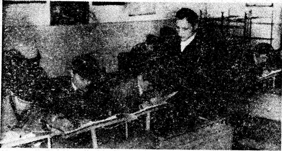
Prelucrarea periodică a normelor de protecție a muncii în atelierelor unde își desfășoară elevii practica productivă, are ca scop prevenirea accidentelor. Un astfel de aspect a fost surprins în atelierul mecanic al Școlii generale din Uricani.