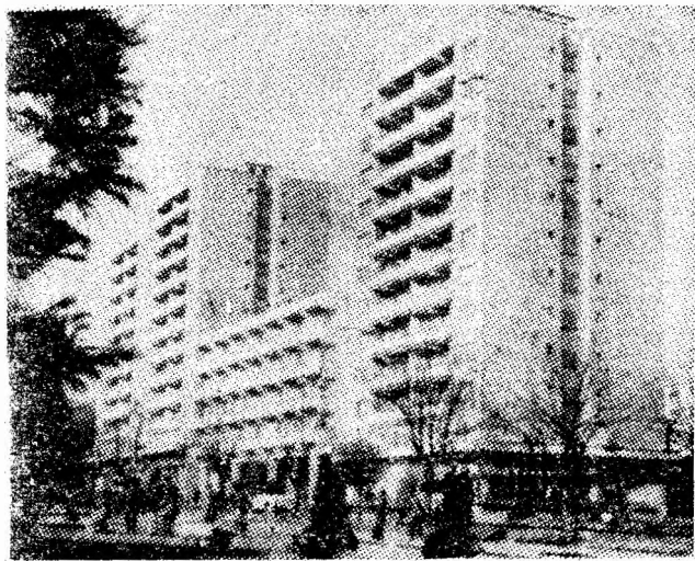
Noul chip al Petroșaniului.