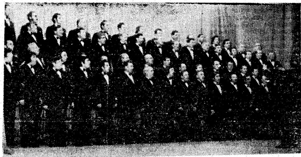
Evoluția corului „Freamătul adincului” al I.M. Petrila.

Din inițiativa c.o.m. de la I.M. Vulcan, zilnic se urmărește modul în care este aplicată inițiativa predării schimbului la fața locului. Colectivele de oameni ai muncii constituite la nivelul sectoarelor, controlează activitatea din sub-