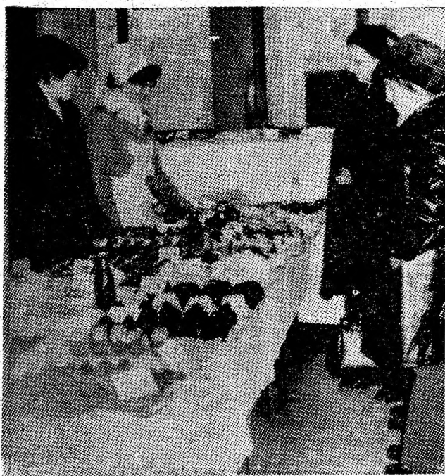
Expozițiile de artă cu lăinară se dovedesc a fi un mijloc eficient de testare a gusturilor cumpărătorilor.