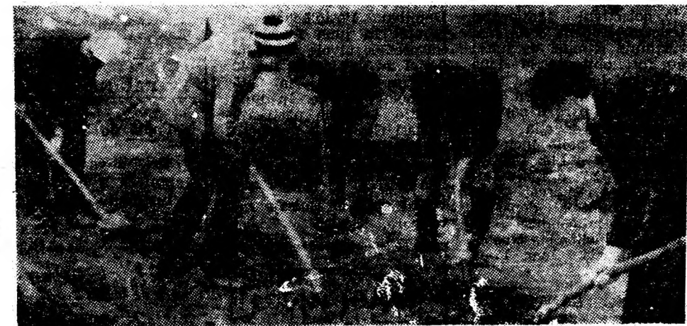
Duminică dimineața, elevii anului II de la Liceul industrial nr. 2 din Lupeni au inițiat o activitate de muncă patriotică avînd ca scop curățirea aleii din fața școlii.

la o amplă acțiune de gospodărire a orașului. S-a curățat artera principală a orașului și s-au plantat brazi. (Al. Tătar)