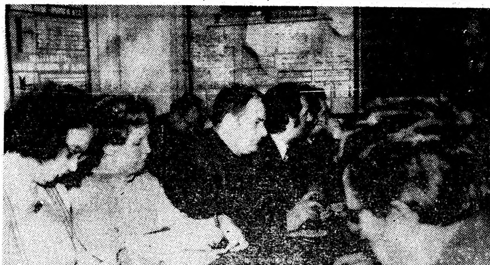
În timpul schimbului de experiență.