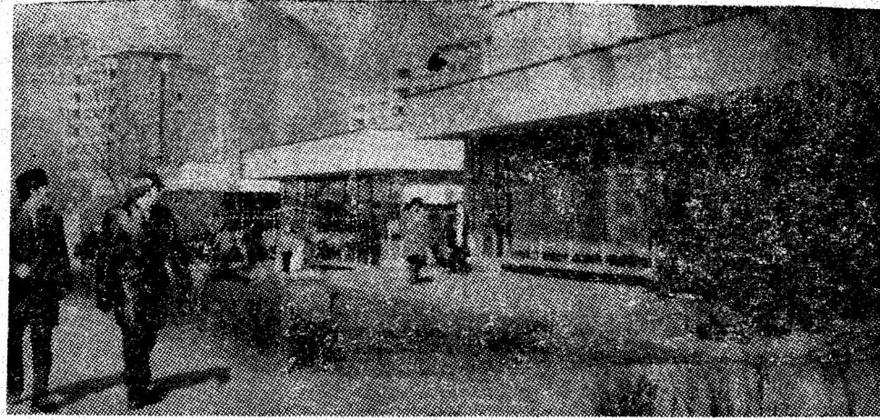
Vulcanul în zi de primăvară.

Amplu, atât prin participare cât și prin program, schimbul de experiență și-a atins scopul, prilejuind celor prezenți generalizarea metodelor înaintate aplicabile în orașul Petrila, în Valea Jiului, în întregul județ pe linia propagandei audio-vizuale și activităților multiple înscrise în aria de preocupări a punctelor de documentare.